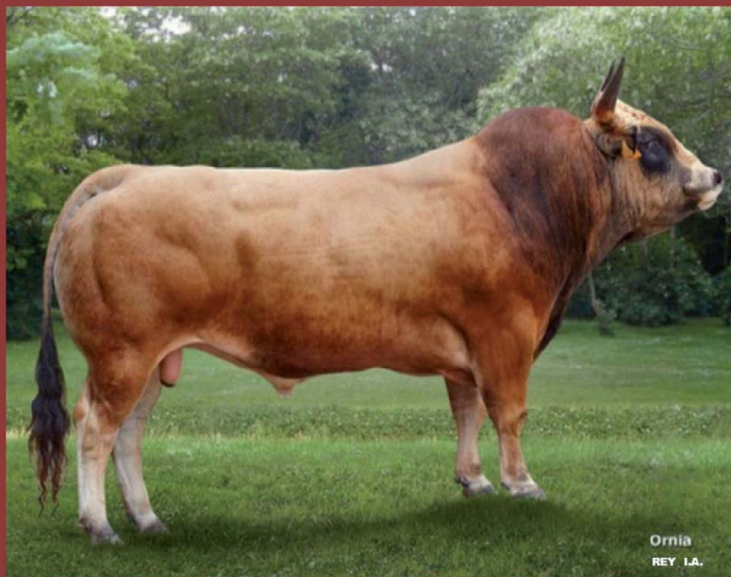
Ornia REY I.A.

Cangas del Narcea - Asturias 26, 27, 28 y 29 de Abril de 2018